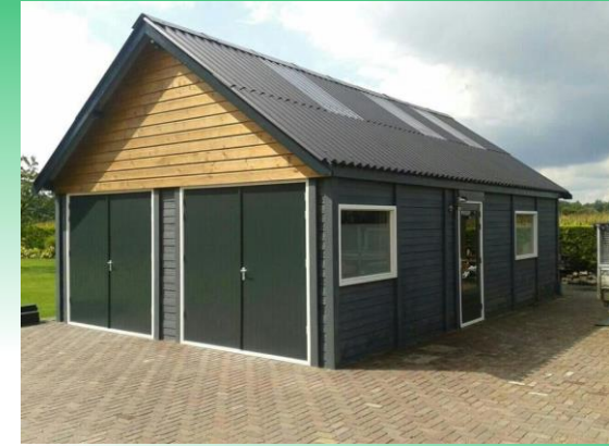
voorbeeld 2 kleuren voor eindafwerking

Alle afgeseald zodat alles waterdicht is.